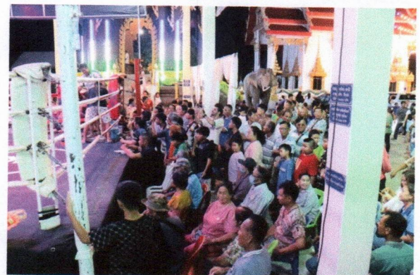
กิจกรรมแข่งขันการชกมวยไทย วันที่ ๑๒ เมษายน ๒๕๖๘