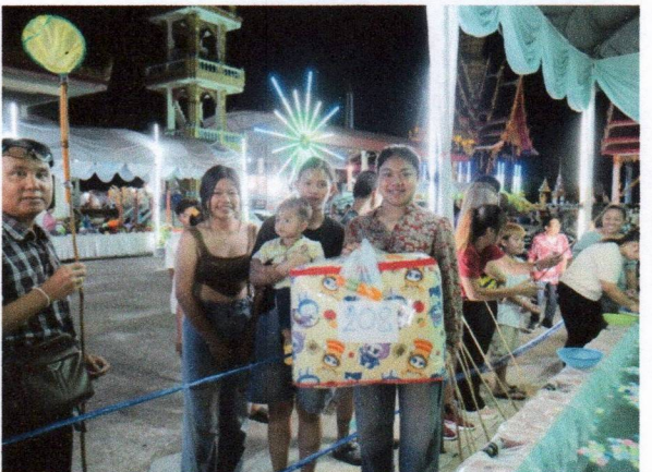
กิจกรรมตกไข่ปลา วันที่ ๑๒ - ๑๓ เมษายน ๒๕๖๘