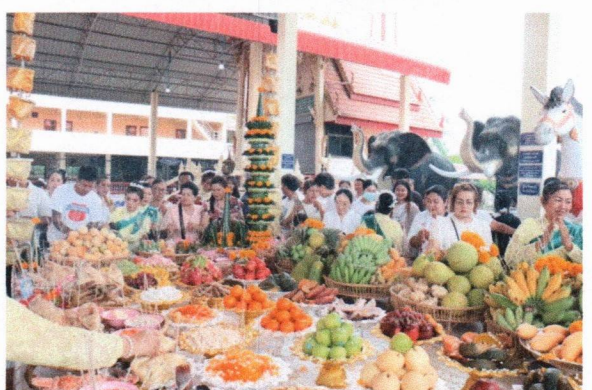
พิธีบวงสรวงหลวงพ่อตั่ง วันที่ ๑๒ เมษายน ๒๕๖๘