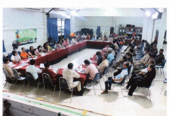
ประชุมการดำเนินการจัดงานปิดทองหลวงพ่อทั้ง ประจำปี พ.ศ. ๒๕๖๘ วันที่ ๔ มีนาคม ๒๕๖๘