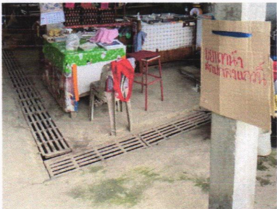
ตลาดมีรางระบายน้ำ พร้อมฝาครอบปิด

๓.๒) ตลาดและบริเวณโดยรอบไม่มีน้ำขังเฉอะแฉะ