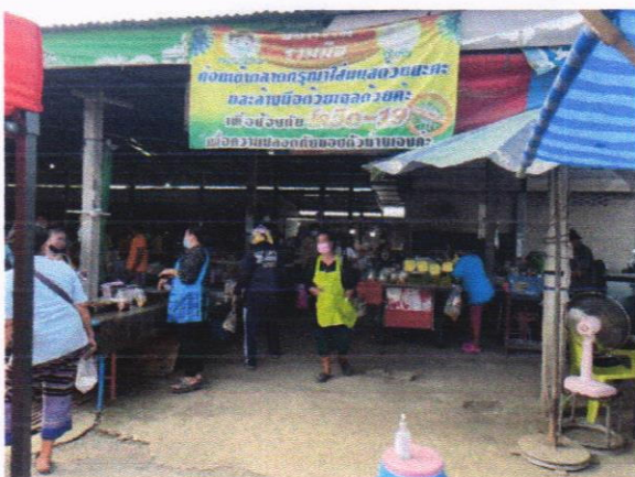
ไม่พบขยะตกหล่นบนพื้นตลาด