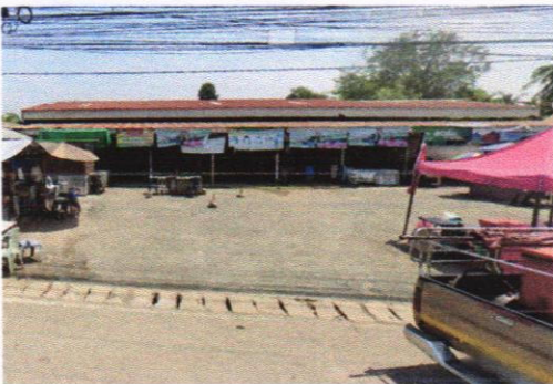
โครงสร้างตลาดแข็งแรงทนทาน