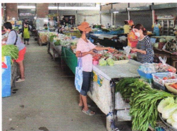
ตลาดและบริเวณโดยรอบไม่มีน้ำขังเฉอะแฉะ