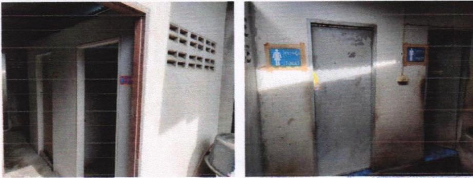
ห้องส้วมแยกเพศ ชาย - หญิง