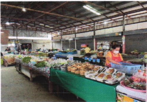
โต๊ะวางสินค้าสูงจากพื้นไม่น้อยกว่า ๖๐ เซนติเมตร