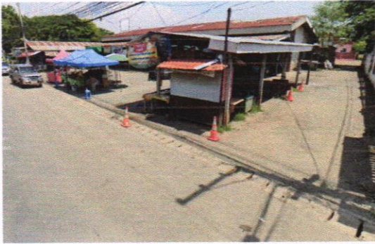
มีที่จอดรถ