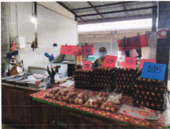
มีป้ายติดราคาสินค้าตามกฎหมายกำหนด และมีตาชั่งกลางเพื่อคุ้มครองสิทธิของผู้ซื้อ