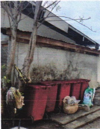
ถังขยะอันตราย