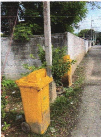
ถังขยะทั่วไป