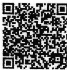
วัคซีนเข็มที่ 3 เพื่อคนไทย