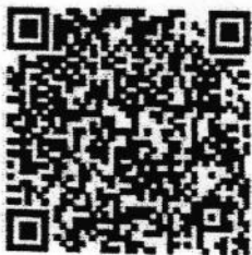
คลิปวัคซีนภาคประชาชน